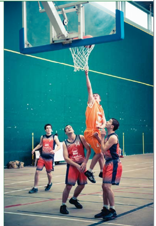
Le hall des sports, connu de tous et reconnu par tous les sportifs, basketteurs en tête

Le Hall des sports est le symbole même d'un consensus local et sa volonté de rassembler en un lieu la population de tout âge. On y rencontre les plus anciens lors de banquets, on y retrouve les familles à l'occasion de fêtes, c'est un pari gagnant. Aujourd'hui ? On y voit évoluer les plus jeunes et les adultes lors de tournois sportifs, de salons ou d'expositions. C'est un choix de garder à l'esprit cette volonté de partage d'émotions. ■