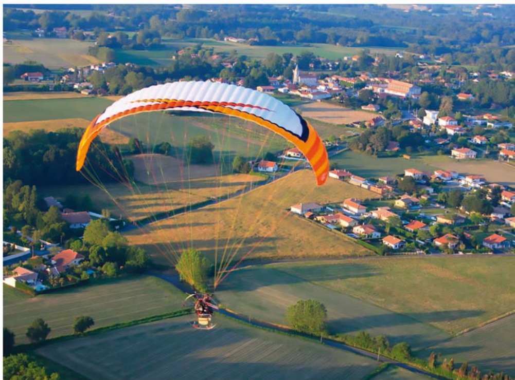
Vol au dessus de Saubrigues, en bas à gauche, le Claous , au fond à droite le centre-bourg avec l'église et le hall des sports